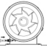
6. Conectar ventilador a la corriente