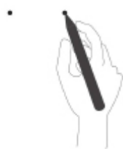
1. Marcar la posición del tornillo en muro