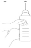
2. Marcar la posición del tornillo en muro